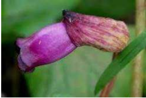
Forest Ghost Flower (फारेस्ट घोस्ट फ्लावर )