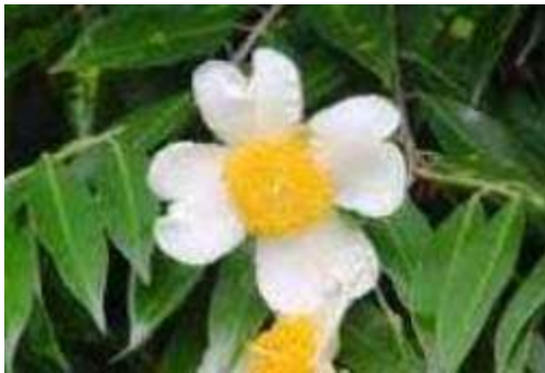
Mesua Ferrea (मेसुआ फेर्रा)