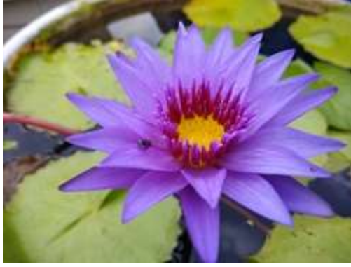
bluewater lily (ब्लूवाटर लिली)