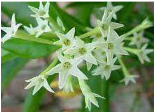
Night Blooming Jasmine (नाईट ब्लूमिंग जास्मीन)