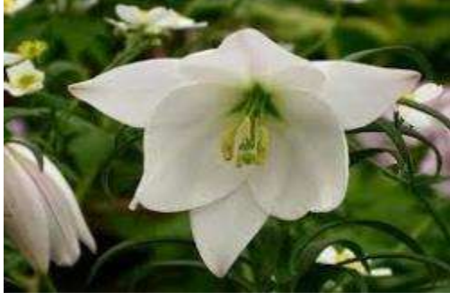
Siroi Lily (सरोई लिली )