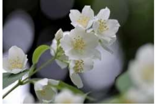
Sweet jasmine (स्वीट जैस्मिन)