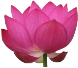
Red Lotus (रेड लोटस)