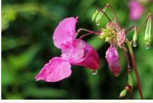
Balsam (ब्लासम )