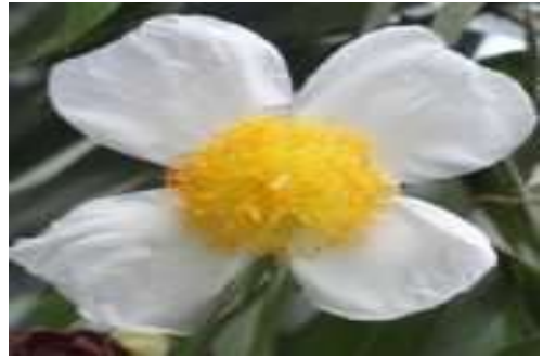
Cobra Saffron (कोब्रा सेफ्रोन)