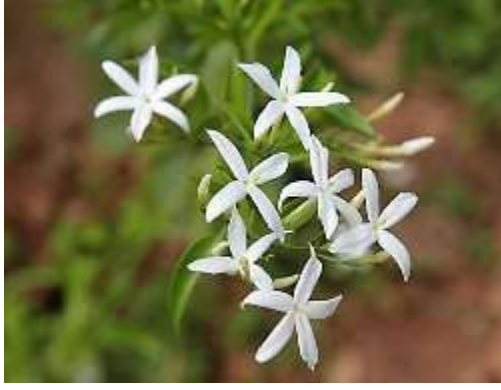
Arabian jasmine (अरबियन जास्मीन)