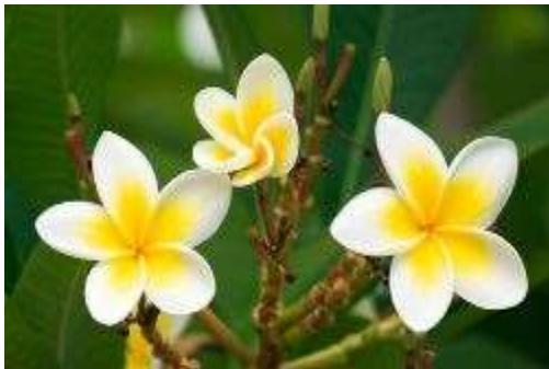
Golden Frangipani (गोल्डन फ्रेंगपानी)