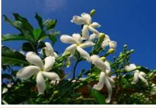
Crape Jasmine (क्रेप जैस्मिन)