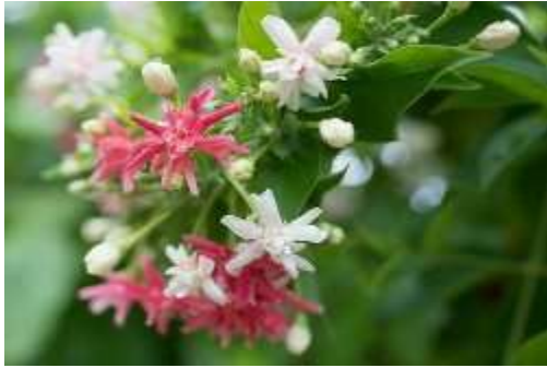
Combretum Indicum (कॉम्ब्रेटम इंडिकम)