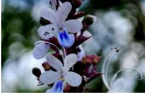
Blue Fountain Bush (ब्लू फाउंटेन बुश)