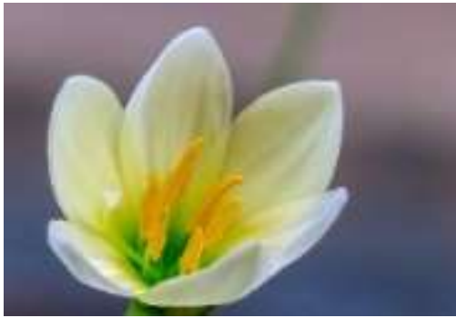
Monsoon lily (मानसून लिली )