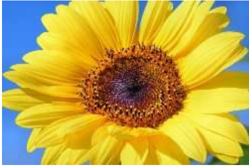
Sun flower (सन फ्लावर)