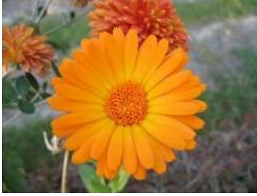
Pot Marigold (पाँट मेरीगोल्ड )