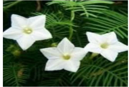
Star Glory (स्टार ग्लोरी)